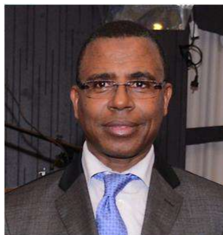
Maître Abdellatif YAGOU Président de l'Ordre National des Notaires du Maroc