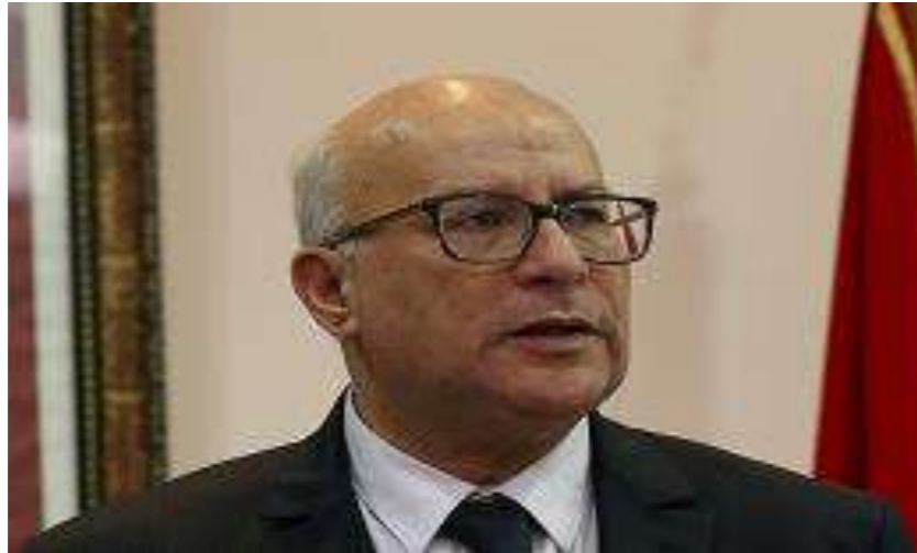
Omar Seghrouchni Président de la Commission nationale de Contrôle et de la Protection des Données Personnelles