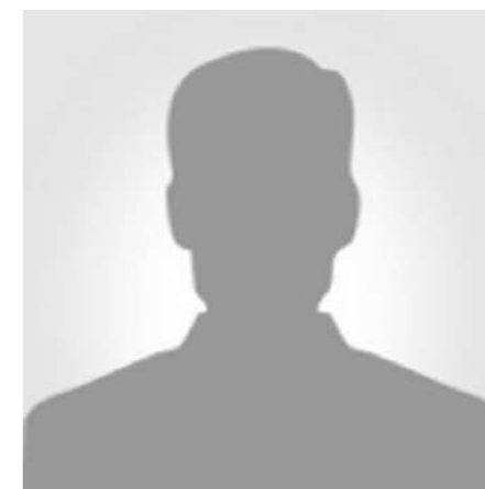
Maître Abdesselam BENZARROU Magistrat