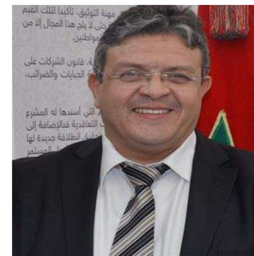
Hafid OUBRAYEM, Président du Conseil Régional des Notaires de Casablanca