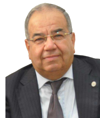
ACHITE-HENNI Abdelhamid Président de la Commission des Affaires Africaines CAAF