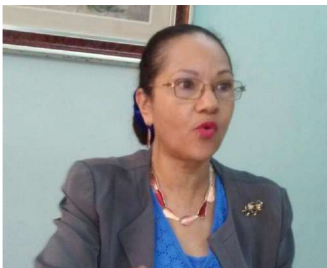
Me Yolande Foldah Kouassi Présidente de la Chambre des notaires de Côte d'Ivoire