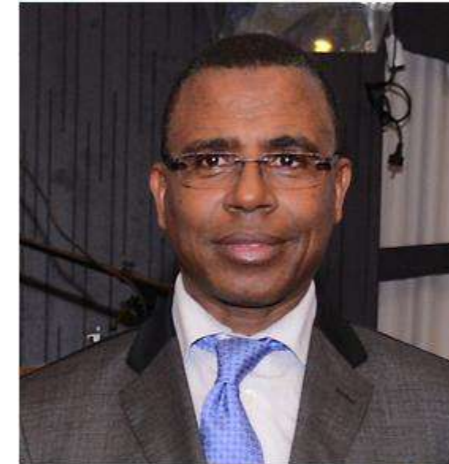
Maître Abdellatif YAGOU Président de l'Ordre National des Notaires du Maroc