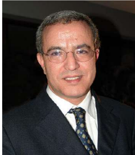
Mohamed AUJJAR Ministre de la Justice